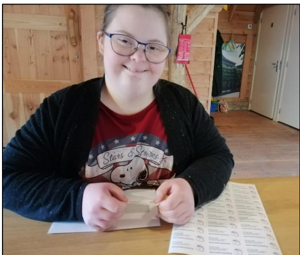
Alleen nog even stickeren

Team Zichtbaarheid/Pastoraat Lucaskerk/Augustinusparochie