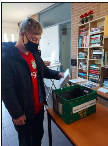
Alweer een stapeltje klaar