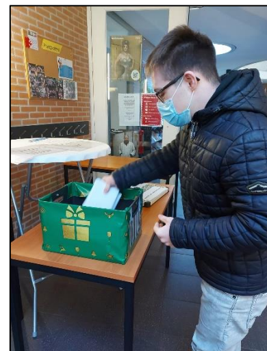
Klaar voor de brievenbus